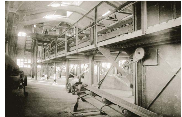
Figura n° 4 - Nuova "cantina" di produzione tipo Kulmann (1949)