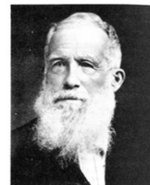
Figure 6-4. Sir John Bennet Lawes, Earl of Roehampton, invented a process for making superphosphate, established the Classical Experiments on his lands at Roehampton Manor, and gave 100,000 Pounds to establish a Trust which could continue the vital long-range research effort.

era nato il "superfosfato di calcio" prodotto sia da ossa che da fosfati di calcio naturali (coproliti)